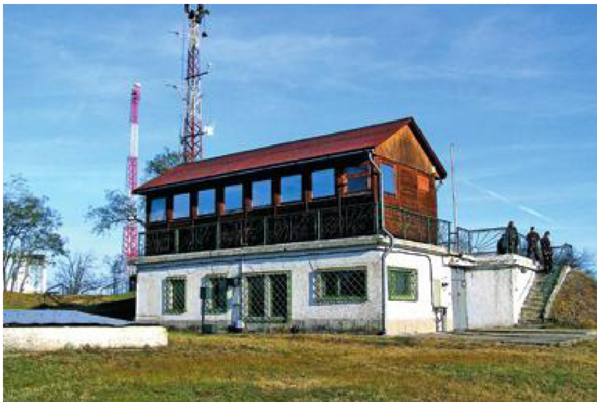
7. ábra. A lőtér központi vezérlőtomya