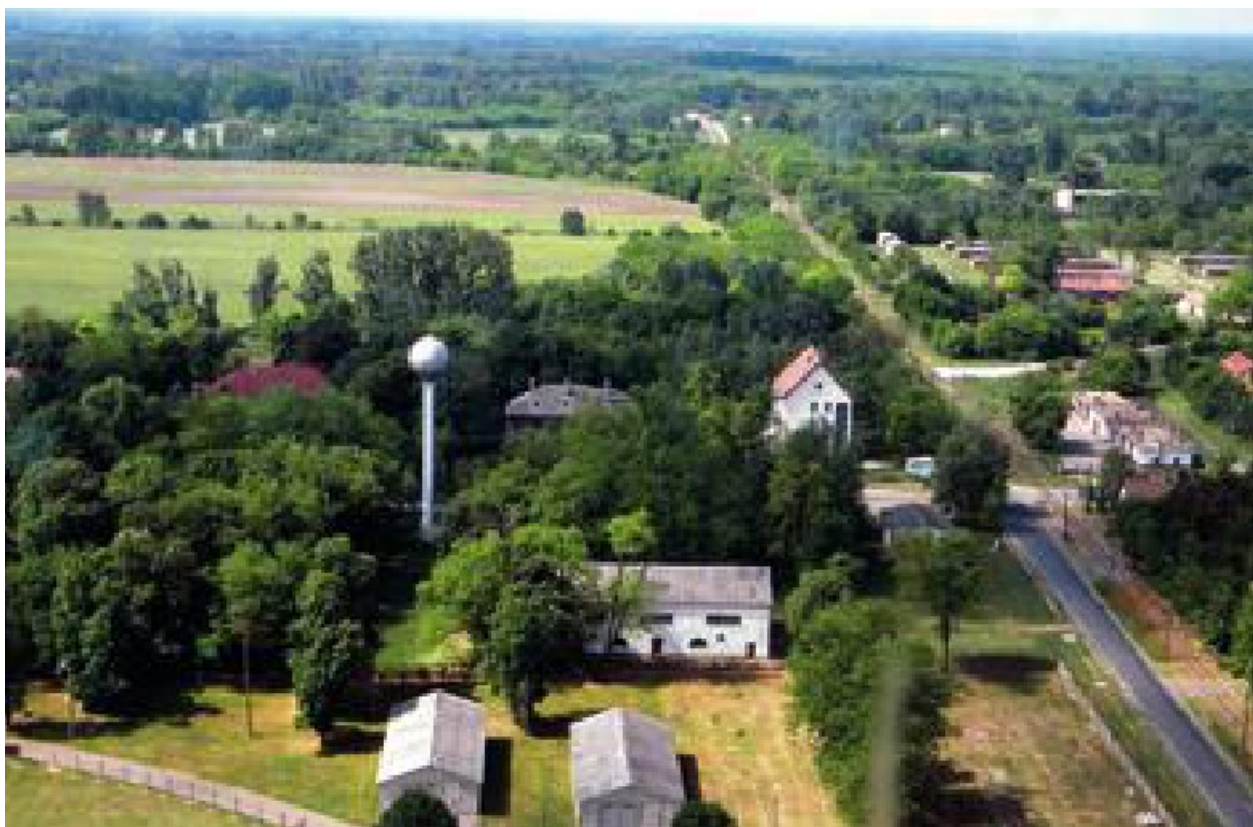
8. ábra. A lőtér központi része, Táborfalva helyőrség