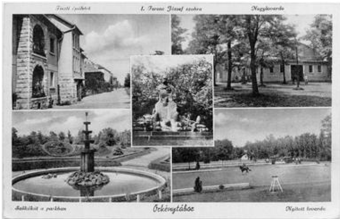
5. ábra. A tiszti lakótelep és környéke egy 1930 után készült képeslapon

A bázis megalakítását követő években a lőtér üzemeltetőjével közösen (MN HTI Lőkísérleti Állomás Táborfalva 6. ábra) kiépítették az első elektromos hálózatot, ennek köszönhetően a célok mozgatása elektromos vezérléssel történt minden gyakorlaton és lövészen. Az 1980-as évek közepétől megkezdődött a lőtér nagyarányú technikai fejlesztése. Tovább folytatták a lőtér elektromos árammal való kiépítését, amit 1989-ben fejeztek be. 1990-től kiépült a lőtér számítógépes célmozgatása is (7. ábra). 1996 márciusától több ütemben az USA hadseregének IFOR erői (nemzetközi békefenntartó) tartózkodtak itt. Velük kapcsolatos feladat volt, hogy a lőteret folyamatos üzemmódban a lövészeikre biztosítani kellett. Ugyanebben az évben kialakítottak és megépítettek egy új, harcjárművek tárolására és javítására is alkalmas telephelyet a lőtér bázisán.