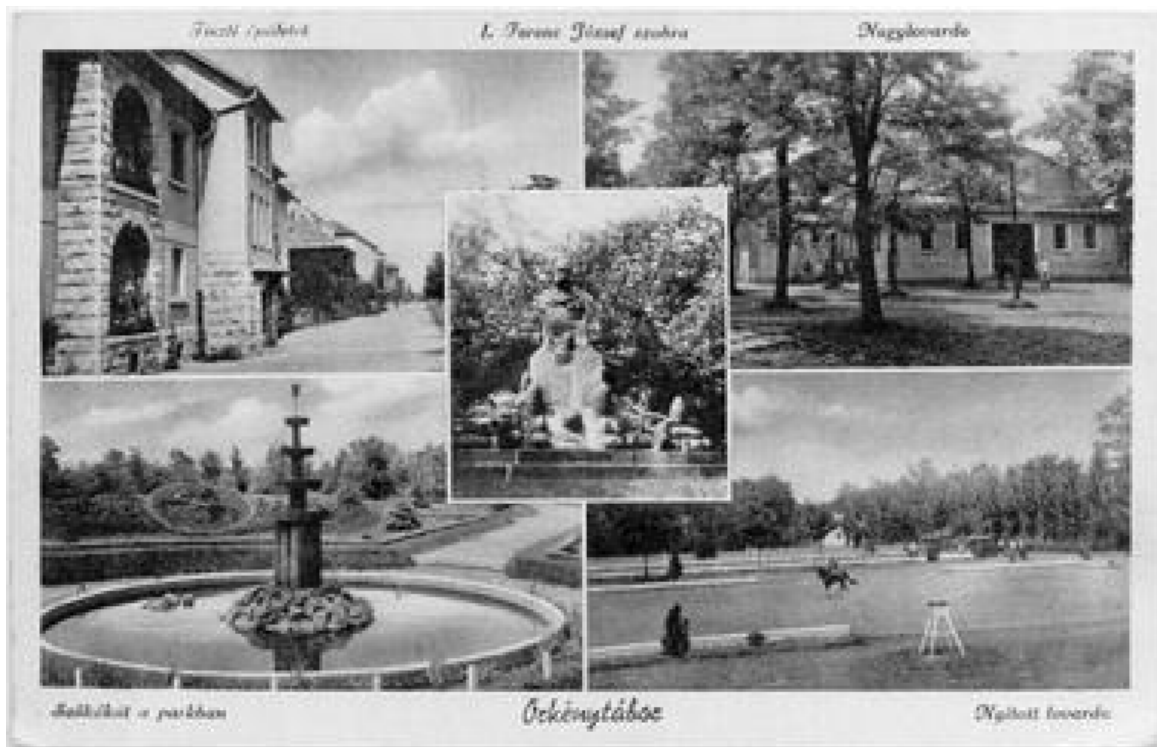
5. ábra. A tiszti lakótelep és környéke egy 1930 után készült képeslapon

1930-tól Európa egyik legnagyobb, mind színvonalában, mind felszereltségében a legjobbak közt említhető lovascentruma épült itt fel. Hasonlóval csak a franciák Saumur (Szomür), a németek Hannoverrel, az olaszok Pineroloval vagy az oroszok Szentpétervárral dicsekedhettek. Az örkénytábori iskola pineroloi mintára épült. A központosításnak és a szakmai kiképzésnek köszönhetően a következő években egymás után jöttek a kiváló eredmények. Az iskola vezetői már akkor felismerték, hogy az 1936-os berlini olimpián elért eredmények (díjugratásban Platthy József Sellő nevű lován III. hely, Militaryban Endrődy Ágoston Pandúr nevű lován egyéni V. hely, Díjlovaglásban Kiméry Pál, Magasházy László, Pados Gusztáv csapat VI. hely, Lovaspólóban IV. helyezést értek el) a jövőre nézve mekkora súllyal bírnak majd. Ekkor a nyitott lovarda és környéke egy több holdon parkosított, szökőkúttal, vízeséssel és szobrokkal díszített terület volt.