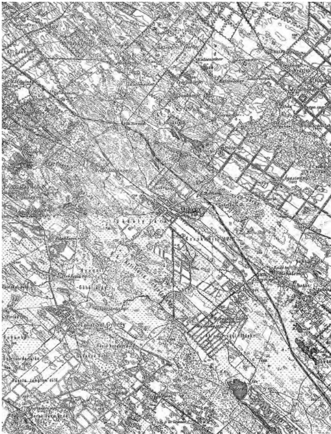
1. ábra. A vizsgált terület az 1869–1887 között készült III. katonai térképen

Váradyné nevéhez fűződik 1875-től a katonai tábor keletkezése (ROGOSZ 2001). Az első területek katonai célokra történő használatáról egy birtokátadási szerződésből tudhatunk. Ebben Váradyné a bécsi udvarnál meglévő kapcsolatai segítségével 1500 kat. hold területet