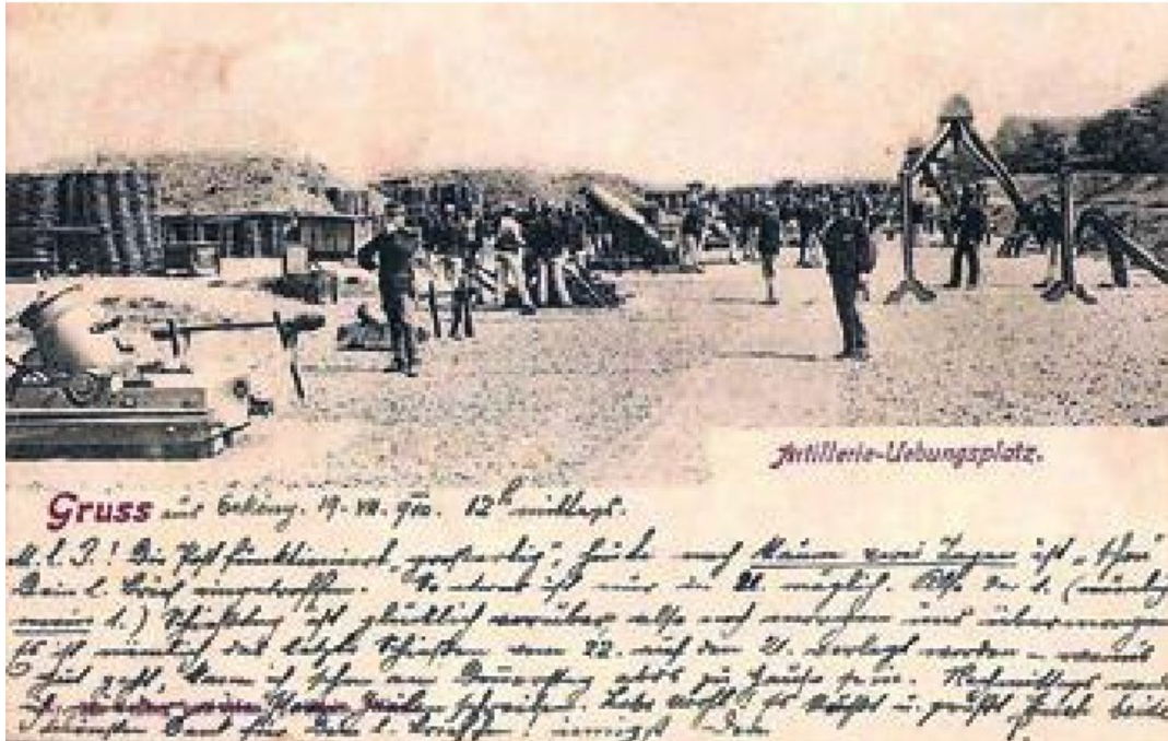
3. ábra. Tüzérségi gyakorlat a XX. század elején