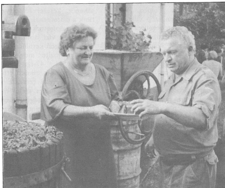
Marika néni és Jancsi bácsi - szüretkor

1 liter tejet felforralok 2 vanília cukorral, a tűzről levéve hozzáadom az előző keveréket, majd lassan besűrítem a tűzhelyen. Egy citrom reszelt héjával ízesítem, ha langyos, hozzákeverem a négy tojás keményre felvert habját. A kockára vágott piskótát leöntöm a krémmel, rá egy sor vékony szeletekre vágott őszibarackot. Addig rétegezem, míg az alapanyag el nem fogy. Utána hűtőbe teszem. Igen finom csemege.