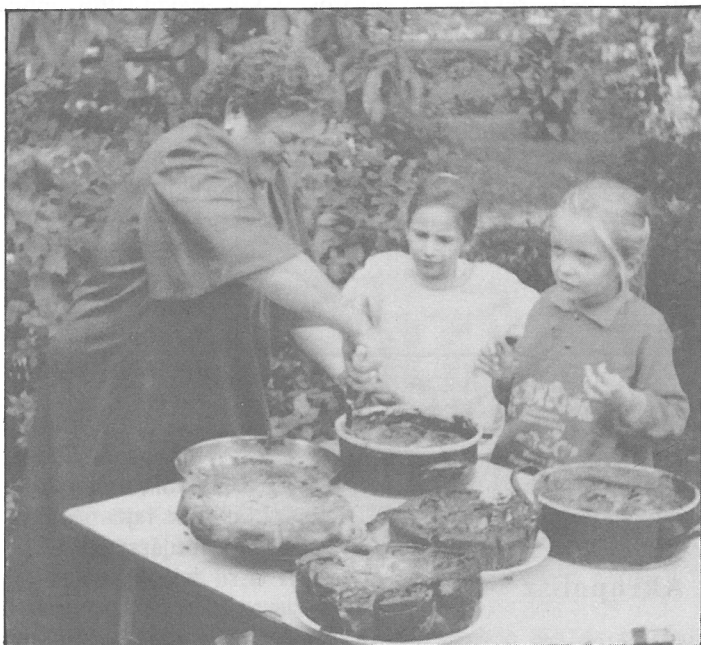
Amikor kész a nagy mű

Álljon itt - bizonyítékul - néhány recept. Kívánjuk, hogy még sokáig élvezhessük a főztjét!