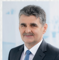
Pogácsás Tibor országgyűlési képviselő, Fidesz-KDNP

Áldott karácsonyt, békés ünnepeket kívánok mindenkinek! Kívánom mindannyiunknak, hogy legyen erőnk, egészségünk, türelmünk céljaink megvalósításához, családjaink boldog életének megvalósításához.