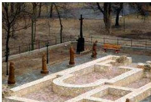
Az alaprajz részlete