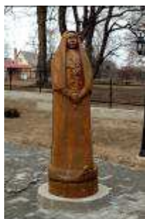
Szent Margit szobra

(*1242. jan. 27. Klissa, †1270. v. 1271. jan. 18. Nyulak-szigete) Árpád-házi hercegnő, domonkos apáca, a rend patrónája, IV. Béla és Laszkarisz Mária lánya. A templomosok klissai várában született, ahol szülei a tatárok miatt menedéket találtak. A hagyomány szerint Isten szolgálatára ajánlották fel, s az ország szerencsésen megmenekült a tatároktól, 1246-ban nevelését, melyet Olimpiades asszony látott el, a Domonkos-rendi apácák veszprémi kolostorára bízta, ahol a Krisztus stigmáit viselő (Boldog) Ilona apáca is nevelkedett. Veszprémből 1254-ben a rend (ma az ő nevééről ismert) Nyulak-szigeti kolostorába került, melynek építését két évvel korábban apja kezdte el. Fogadalmát 1254-ben ott tette le, s bár családja később többször férjhez akarta adni, a kolostort soha többé nem hagyta el. Falai között a legalantasabb munkákat végezve szegényesen élt. Folyvást vezekelt, például apjuk és bátyja (az 1263. évi oklevelében Inárcsot először említő, s az inárcsi várjobbágyokat katonai szolgálatába fogadó István ifjabb király) hatalmi harca miatt, akik 1266-ban a szigeten kötöttek békét. Mindezek következtében szervezete teljesen legyengült, és 29 évesen elhunyt.