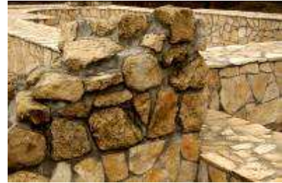
A templom eredeti kövei az alapban

Der Gedenkpark stellt ein stetes und würdiges Gedenken dem einen halben Jahrtausenden lang blühenden Dorf und seiner Kirche. Zuerst macht sich das Markkreuz ( das Werk von Ferenc Polyák ) um den rekonstruierten Konturen des ehemaligen Fundaments bemerkbar. Das Markkreuz stand ursprünglich seit 1998 westlich von der originellen Stelle, am Straßenrand. Die Hauptgestalt der Komposition ist der König Stephan der Heilige. Seine Figur symbolisiert den ungarischen Staat und wird an den Schultern von zwei robusten Bauernfiguren gehalten, die Symbole des ungarischen Volkes sind. Das Kreuzifix und der Corpus Christi wird von König Stephan gehalten. Damit wird betont, daß die Grundlagen des ungarischen Staates in der Aufnahme des Christentums verwurzelt sind. Am Patron der Kirche Sankt Georg „dem Drachentöter“ erinnert ein Relief. Der ebenfalls von Ferenc Polyák geschaffener Glockenstuhl erwächst aus dem Standbild zweier heiliggehaltenen Bischöfen. Über den Standbildern sieht man das Relief eines heiligen Königs. Die Kolumnen werden von einem rustischen Dach vollendet. An der Spitze des Daches strebt ein Kreuz in die Höhe. Der Bronzeuß der Glocke ist von einem Reiterbild Sankt Georgs geschmückt, das den Heiligen in dem Moment zeigt, wo er den Drachen mit seinem Speer tötet.