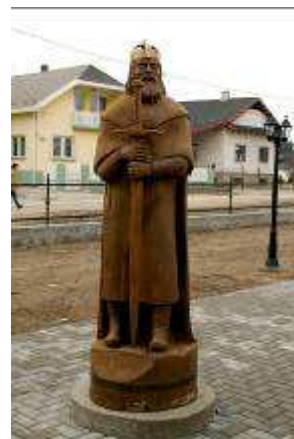
Szent István szobra

(*967, 969 v. 975. †1038. aug. 15.), eredeti nevén Vajk, magyar király, Géza fejedelem és Sarolt gyermeke, akit a hagyomány szerint Adalbert prágai püspök keresztelt (ill. bérmált) meg. Géza halála után, 997-ben lett fejedelem, mely címre legidősebb rokona, Koppány is igényt tartott. Leverésével uralma alá vonta a Kárpát-medence nyugati, 1003-ban anyai nagyapja, az erdélyi Gyula legyőzésével pedig keleti felét. Közben 1000. december 25-én (v. 1001. jan. 1-jén) egyházi szertartás keretében királlyá koronázták a III. Ottó császár és II. Szilveszter pápa által küldött koronával, majd bel- és külpolitikai téren is megszilárdította hatalmát. Ajtonyt megtörve (1008 v. 1028) és a bolgár Keánt leverve kisajátította az ellenállók birtokait, s közben a kabarok vezére, Aba Sámuel és Vata törzse is behódolt neki. 1018 körül Vitéz Boleszláv lengyel fejedelemtől visszafoglalta a Morva és a Vág vidékét, megverte Sámuel bolgár cárt, megnyitotta a hazánkat átszelő jeruzsálemi zarándokutat, 1030-ban pedig II. Konrád császártól védte meg országát.