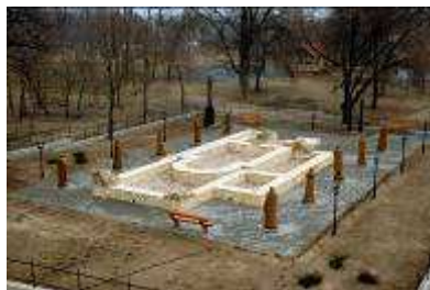
Az emlékpark részlete

A templom talajszintből kiemelkedő alapjait díszkövel kirakott sétány övezi, melyeket Szűcs Farkas László tíz tölgyfából faragott szobra, torony) két sarkánál pedig Polyák szegélyez. Köréjük a parképítési díszfákat telepítenek. A sportparkhoz képéhez jól illeszkedő emlékparkot alapjai megegyeznek a fémből készült kapu és a szobrokat megvilágító kandeláberekkel harmonizálnak.