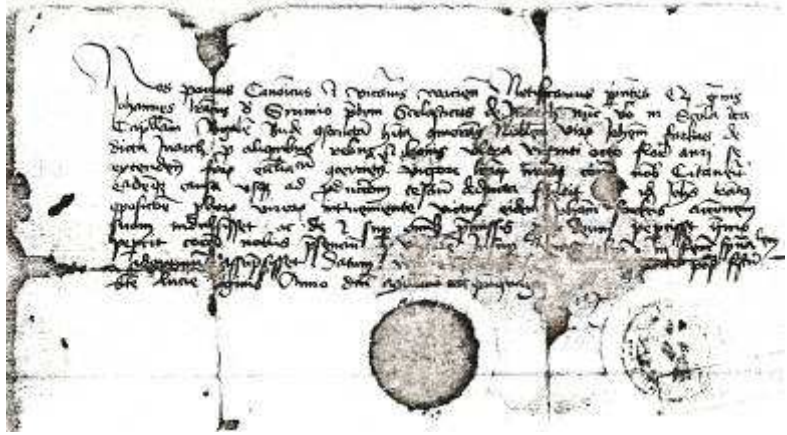
Az inárcsi tanítót említő 1450. évi oklevél

Az 1453-ban említett Farkas Jánosról azt is tudjuk, hogy három évvel korábban zárta le azt a pert, melyet bizonyos egyházi pénzek miatt Szerémi János deákkal folytatott. „Johannes literatus de Sirimio”-t az oklevél „volt inárcsi tanító”-ként említi, a plébános 1450 előtt tehát már világi képzettségű emberrel osztotta meg a népes faluban egyházi és világi feladatait. A (talán inárcsi járandóságaival összefüggő) per lezárása idején Szerémi már a budai királyi kápolna mellett működő iskolában látta el a főnemesi utódok, vagyis az udvari ifjak általános közismereti képzését, míg a liturgia