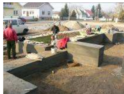
Épül az emlékpark