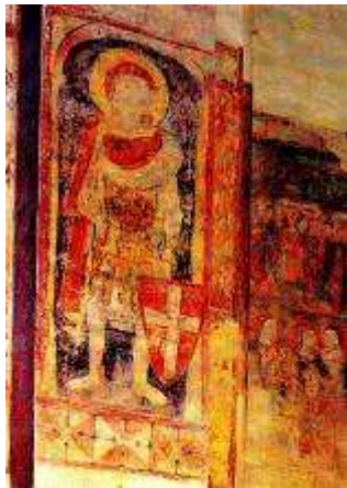
Szent György ábrázolása az ócsai bazilikában

Az Inárcson feltárt alapfalak rekonstrukcióján a templom szerkezete és építésének periódusai is kirajzolódnak. Középen, akár a pótharaszti pusztateplomnál, a legrégebb, román periódus kisebb templomának alapjait látjuk, melyre a rekonstrukció