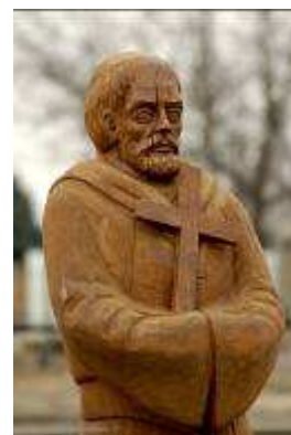
A Szent Gellért-szobor részlete

(*997 után, Velence. †1046. szept. 24. Buda) püspök, vértanú, teológiai író. A velencei Sagredo (patrícius) családból származott. Gyermekként lépett be az ottani Szt. György bencés apátságba, majd Galliában tanult. Magyarországra szárazföldi zarándoklatának meghiúsulása miatt 1023 körül került, s 1030-ig a Bakonyban volt remete. Ekkor I. (Szt.) István marosvári (csanádi) püspökké nevezte ki, mely után nagy buzgalommal látott hozzá egyházmegyéje és a papi utánpótlás megszervezéséhez s a lakosság keresztény hitre térítéséhez. Ötven főúr kivégzése miatt – kezdeti együttműködésük ellenére – szembeszállt Aba Sámuellel, de türelmetlen, zsarnoki politikájáért I. Pétert is elítélte.