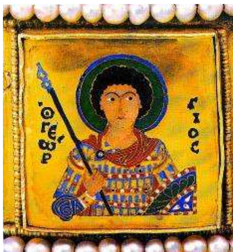
Szt. György a Szent Korona zománcképén

melynek egykor letört hosszanti alsó szára hiányzott, a templom északi hajófalának árkából került elő, két hatalmas kő közé szorulva mintegy 80 centi mélységben pihent a törmelék között. A valószínűleg egy egyházi méltóság által viselt kereszt megformálása 11-12. századi készítést valószínűsít, s bár hasonlóak ismertek, eddig még nem került elő párhuzama.