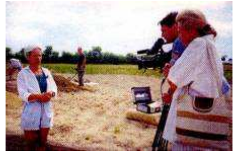
A Duna TV riportja az ásatáson

A templom köveinek maradványai a vasút és a Rákóczi út északnyugati kereszteződésének közelében, a térség legmagasabb részén jelölték ki az egykori templom helyét, melynek feltárása a gyér szórványanyag alapján néhány hetes munkának ígérkezett. Az elkészült kutatóárokok és kutatószelvények feltárása alaposan rácsfolt erre, hiszen csak a fontosabb részletek feltárása több mint tízhetes munkát igényelt. Az ásatás először is lehetővé tette a templom alaprajzának és építési periódusainak rekonstruálását. A templomnak több periódusa volt. A legrégebbi még román kori, tehát jóval megelőzi az írásos emlékekből kirajzolódó korszakot. A legkésőbbi periódus viszont egy késő középkori átépítésre utalt, amit valószínűleg a falu gazdasági erejének és népességszámának növekedése követelt meg a 14-15. században.