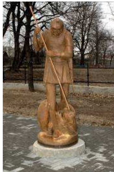
Szent György szobra

Hazai kultusza a kereszténység felvételéig nyúlik vissza. A kereszttségben Gellért püspök is az ő nevét kapta, őt választotta a veszprémi püspöki egyház patrónusául (ld. a veszprémi vár Szt. György kápolnáját), és Szent György a Szent Korona alsó, bizánci részének egyik zománcképen is látható. Kultusza jegyében alapította Károly Róbert 1318-ban a Szent György lovagrendet (melynek kötelessége volt az istenfélelem, a foglyok megváltása, a szegények segítése, a király iránti hűség, a lovagi erények vállalása, a haza védelme). Ebből nőtt ki a Zsigmond király által alapította Sárkány-rend is, melynek jelvényén a sárkány „farka a nyaka köré csavarodik, és a háta közepén, fejtől a farkáig fehér mélyedésben vörös kereszt van, miként a Szent György zászlaja alatt vitézkedők [is] fehér mezőben vörös keresztet hordanak”.