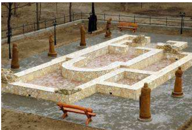
A templom építési periódusainak rekonstrukciója az inárcsi emlékparkban

A félkörös szentélyzáródású Árpád-kori román templom Pótharaszton 4,7 x 8,5 méteres, Inárcson 6,8 x 9,3 méteres volt, mely a gótikus bővítés után Pótharaszton 4,7 x 13,0 m-re, Inárcson 9,8 x 20,3 méterre növekedett meg. Természetesen nem érhetette el a mintegy 39,5 x (a kereszhajó révén) 28,0 méteres ócsai templom nagyságát, hiszen az egy kora gótikus, kereszthajós, háromapszísú bazilikának épült később. Amikor franciaországi Laon völgyének premontrei barátai ideérkeztek, s az 1230-as évekre a bazilikát és a kolostort a kora Árpád-kori gödörházak helyén építeni kezdték, az inárcsi román templom már legalább egy évszázada állhatott.