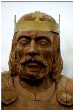
A Szt. László-szobor részlete

(*1040 k. †1095. júl. 29.) magyar király, I. Béla és Richeza lengyel hercegnő fia. Lengyel földről 1048 táján érkezett családjával haza, majd részt vett a gyermek Salamon megkoronázásán. I. András és Béla konfliktusában