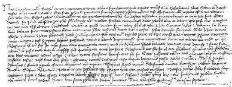
A Szent György-templom egy 1427. évi oklevelén

A mai Pest megye középkori templomai közül 142 esetben van adat 18 patrónusra. A leggyakrabban (22, közte Ócsa és Dabas) Boldogságos Szűz Máriát és Szent Mártont választották (15 helyen)