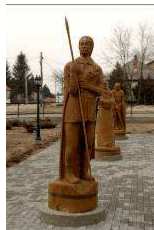
Szent Imre szobra

(*1000/1007, †1031. szept. 2.) herceg, I. (Szent) István király és Gizella bajor hercegnő fia. Nevét anyai nagybátyja, II. Henrik (Emericus/Imre) német-római császárról kapta. A nagyobbik Gellért-legenda szerint Gellért püspök volt a nevelője (legalábbis ő készítette fel hitének követésére), felesége pedig Margit bizánci (más hagyomány szerint horvát vagy lengyel) hercegnő. A Hildesheimi Évkönyv szerint Imre a oroszok hercege címet viselte, amit a dunántúli orosz határőrnépek, mások a királyi testőrség vezetőjeként értelmeznek. Itt említik azt is, hogy 1031-ben egy vadkan okozta halálát. A hegyközségszentimrei monostor kegyurasága alapján (ma Sintimreu, Románia) a végzetes vadászat a bihari erdőségben, vagy a porvai monostor titulusa szerint a Bakonyban lehetett. Halála után a székesfehérvári bazilikában temették el.