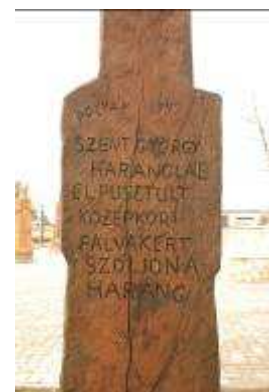
A harangláb felirata