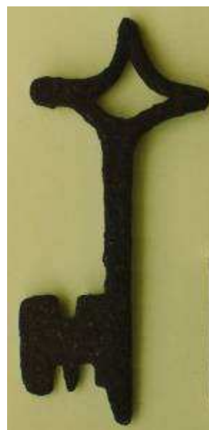
Egy 13. századi vaskulcs Inárcsról

A négy ifjú erdélyi ispán korában is hűséggel szolgálta az apjával konfliktusban álló ifjabb királyt, aki ezért 1271-ben nemes várjobbágnak ismerték el őket, IV. László pedig 1275-ben szerviensi jogállást biztosított nekik. Miután a falu nemesi birtokká vált, Inárcs Fehérvár függéséből kivált, az itt élő várnépek pedig az ő jobbágyságuk lettek. 1347-ben Nagy Lajos még bíraskodási jogot adott Fene unokájának, Márk fia Máténak, de a népesség gyors szaporodása az Anjou-kor végére azzal a következménnyel járt, hogy jobbágyságuk elszelléresedtek. Inárcs végül is köznemesi faluvá fejlődött, ahol a 15. században már kizárólag földjükön jobbágy módjára gazdálkodó nemesek és kuriális földön ülő parasztok éltek. A falu lakossága a 14. században 18-45, a 15. században 28-65 családra becsülhető (népességszáma ennek mintegy hétszerese lehet), mely jóval meghaladta az országos átlagot. Ennek becsülésénél és a középkori viszonyok rekonstruálásánál szerencsés helyzetben vagyunk, hiszen a Mohács előtti századok egyetlen viszonylag teljes családi irattára épp Inárcsról maradt meg megyénkben, a 17. sz. elejétől Nagykőrösön élő Farkas család tulajdonában.