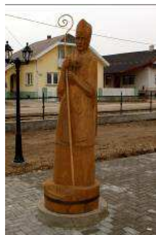
Szent Adalbert szobra

Rómába, 994-ben Aachenbe ment, hogy tisztjéről lemondjon, de a pápa utasítására mégis visszatért Prágába, ahol kolostort alapított. Végleges lemondása (996) után rövid ideig Magyarországon végzett térítő munkát, majd Franciaország szent helyein járt. Mivel II. Boleszláv 995-ben egész rokonságát kiirtatta, egy nyugati zarándokút után hazatérés helyett Lengyelországba ment, s ott is kolostort alapított. Amikor Bátor Boleszláv lengyel fejedelem megbízásával a poroszok megtérítésére indult, a Visztula közelében társaival együtt mártírhalt. Gnieznóban temették el. Ereklýéinek egy részét barátja, III. Ottó Aachenbe vitte, majd szentté avattatta (ünnepe április 23.). A hagyomány – a pályája során a magyar fejedelmi udvarban is többször megforduló – Adalbertnek tulajdonítja Vajk (István) megkeresztelését (bérmlását). A később Pannonhalmának nevezett hegyen hazánkba menekült társai alapították meg a Szent Márton monostort. Az itt kibontakozó Adalbert-kultusz sugallatára – rövid itthoni térítő munkája alapján – a korábbi eléképzelések őt tekintették az ország igazi megtérítőjének.