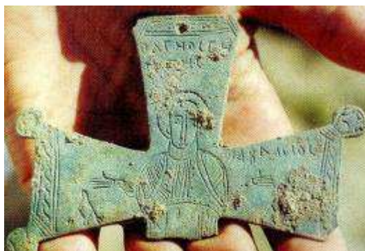
Az inárcsi Szent György-kereszt a felfed