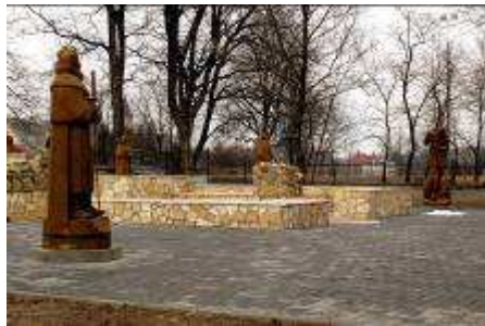
Az emlékpark részlete

Heilige Elisabeth von Ungarn ( gestorben in Marburg 1231 ) war die Tochter von Andreas II. und seiner Gattin Gertrud von Andechs-Meranien. Als die Verlobte des Sohnes des thüringischen Landgrafs Herman II. wuchs sie in der Wartburg auf, und nach dem Tod ihres Verlobten heiratete sie den Landgraf Ludwig IV. Im Gegenteil zu ihrem hohen Rang fastete sie oft, lebte ein erhaltendes, frommes Leben, sie unterstützte die Armen und Bedürftigen. Die Landgräfin lebte nach dem Tod ihres Gemahls in strenger Askese weiter, und bei ihrem Grab in Marburg wurden 58 Wundertaten aufgezeichnet.