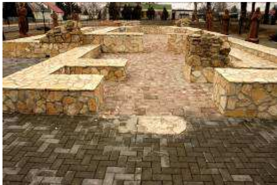
Ilyen lehetett az egykori alaprajz

Inárcson a K–Ny-i helyett ÉK–DNy-i irányba tájolták a szentélyt, mint a ma Csévharaszthoz tartozó,