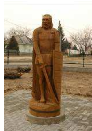
Szent László szobra

Egyházpolitikájában sem vette figyelembe a pápaság érdekeit (Szlavóniában megszervezte a zágrábi püspökséget, a bihari püspökség székhelyét Váradra helyezte, és új apátságokat alapított). Az egyház megerősítése mellett nevéhez fűződik az ország megingott rendjének helyreállítása, amit rendkívül szigorú törvényei is szolgáltak. Kiváló hadvezérként volt ismert (1085-ben kiűzte Salamon támogatására betörő besenyőket, 1091/1092-ben a fosztogató kunokat, 1092-ben az orosz, 1093-ban a lengyel, 1095-ben a cseh uralkodó ellen vezetett hadjáratot). 1095-ben történt halálakor Somogyvárott temették el, 1113 után pedig Váradra vitték hamvait. A középkori Magyarország legnépszerűbb uralkodójaként a „lovagkirály” kultuszának elterjedéséhez III. Béla tette meg a döntő lépést, akinek kezdeményezésére 1192-ben szentté avatták. Csodákról számot adó legendái közt legismertebb a leányrabló kun (besenyő) vitézzel vívott (kerlési) párbaja, mely számos templomképen is megtalálható. A Szent László–legendaciklus három jelenetét (üldözés, birkózás, lefejezés) az ócsai premontrei bazilika (ma református templom) szentélynégyzete északi falának freskóin is felfedezték.