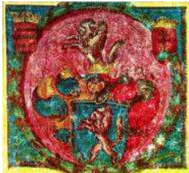
Az Inárcsi Farkasok beszélő címere

A Szent György-templom kegyúri jogait a helybeli nemesek gyakorolták. Ez magas presztízst jelentett, mely a kegyúrnak fontos döntési jogokat biztosított. 1368-ban az elpusztult Vány földjének eladása ezért az ottani Szent György-templom kegyúri jogaira is kiterjedt; Hernádon a Szent Kereszt-templommal együtt 1388-ban a patronátust is megosztotta a rokonság, Gyónon viszont 1417-ben a zálog alól kivonta és magának tartotta fenn a kegyúri jogot. A kegyúr tehetett javaslatot a püspököknek a pap személyére, és beleszólhatott az egyház vagyoni ügyeibe is. Felügyeletet gyakorolt a misék rendje felett, amelyen családját megkülönböztetett hely illette meg, elhunytakor pedig nem a templom körüli temetőben (a cinteremben), hanem – mint majd az inárcsi feltáráson látni fogjuk – az épület padozata alatt temették el. A korabeli emberek mélyen vallásos életet éltek, amit Inárcsi Rádai János végrendelete is igazol. Ebben tizennyolc név szerint felsorolt inárcsi rokon jelenlétében 1518. augusztus 18-án „lelkét a teremtő Istennek ajánlotta”, és azt kérte, hogy testét Szent Margit hajdani életének színhelyén, a „Boldogságos Szűz nyúl-szigeti kolostorában temessék el”, birtokainak egy részét pedig örökös mise tartása fejében a kolostorra hagyta.