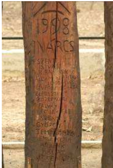
A Jelkereszt felirata

Az 1200 m 2 -es (60 x 40 m) emlékpark a 19. század végén épült Tolnay-kúria parkja (ill. a mai sportpark) északnyugati, József utca és az azt Dózsa térrel összekötő köz által határolt részén épült meg, az