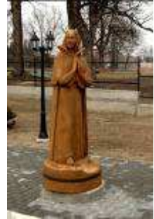
Szent Hedvig szobra

(*1374. †1399. júl. 17. Krakkó) Anjou-hercegnő, lengyel királynő, Nagy Lajos magyar király és Boszniai Erzsébet harmadik gyermeke. Vilmos ausztriai herceggel négyévesen házasították össze, ami tizenkét éves korában valósult volna meg. Noha Lajos őt jelölte a magyar trónra, azt halála után nővére, Mária, míg ő a lengyel trónt kapta. Lengyelország királynőjévé 1384. október 15-én Bodzanta gnieźnói érsek megkoronázta, Vilmost azonban a lengyelek nem fogadták el királynak. A lengyel nemesség nyomására Hedvig ezért 1386. február 1-jén Jagelló litván nagyfejedelemmel kötött házasságot, aki II. Ulászló néven lett király, s a két ország között így létrejöhetett az unió. Jagelló egész népével katolikus hitre tért, s áttérésüket Hedvig is segítette.