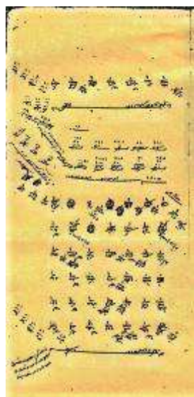
A török adóösszeírás részlete