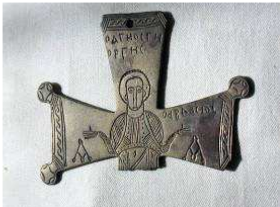
A különleges mellkereszt

Szent Györgyöt ábrázoló mellkereszt pedig, melyet a romok között fedeztek fel, igazi ritkaságnak számított. Noha a feltárás költségei ily módon lényegesen meghaladták a tervezettet, a millenniumi rendezvények tömeges igényei miatt a község sem arra, sem az emlékpark megépítésére nem kapott támogatást, így csupán Tolnay Lajos bronzszobrának elkészítésére volt lehetőség.