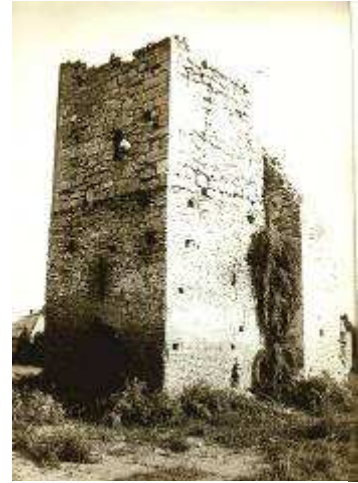
(Pusztavacsi) templomtornyának romjai

A toronyrészlet jól látható a pusztavacsi téglateplom romjain, és később erősen megmagasítva a kéttornyú ócsai bazilikán is. Harangról a gyáli Szent György-templomból van tudomásunk, s egy harangtöredék a pótharaszti templom romjai között is megmaradt. Az épületek liturgikus tárgyai között olykor előkerülnek a kőből készült keresztelő medencék, szenteltvíztartók, a fémből készült oltár- és körmeneti keresztek (néha a tatárok okozta veszteségek pótlására a francia Limoges műhelyeiben 1241 után exportra gyártott rézkeresztek). Ritkábban füstölők, gyertyatartók, kelyhek és textíliák, továbbá (mint Cegléd-Nyúlfelehalmon) az esetenként ereklyetartóként is funkcionáló papi mellkeresztek bukkannak a felszínre.