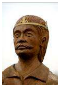
A Szt. Imre-szobor részlete

Apja kezdeményezésére számára állították össze az egyetlen magyarországi királytükört, az Intelmeket. 1083. november 5-én őt is I. (Szent) László avattatta szentté, kötelező ünnepnapjai: szeptember 2. és november 5. Már a legrégebb liturgikus emlékek említették, a 12. századtól pedig közel félszáz templom védőszentje volt, mely 18 esetben a helynévben is megjelent. Kultusza Lengyelországban is elterjedt, legrégebbi portréja a koronázási paláston István és Gizella között látható. Később számos falfestményen és oltárképen ábrázolták, gyakran páncélban, fegyveresen, az Anjou-korban pedig Szt. Istvánnal és Szt. Lászlóval együtt, mint Árpád-házi „szentkirályokat”. Az 1106–1116 közt bencés környezetben szerzetesi olvasmányként íródott, s hiteles történelmi forrásnak nem tekintett legendája a házastárs, de gyermektelen Imrében a szűzi tisztaság megtestesülését tisztelte.