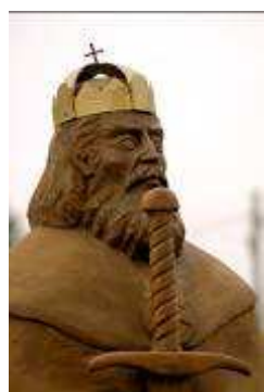
A Szt István-szobor részlete

Egyháztörténeti érdeme, hogy (a görög keleti egyház híveivel megfelelő türelmet tanúsítva) megkezdte hazánkban a latin rítusú egyházi szervezet kiépítését. Tíz püspökséget és számos bencés monostort alapított, s elrendelte, hogy minden tíz falu építsen templomot. Az országot 45 vármegyére osztva a királyi birtokokat udvarhelyekké, várispánságokká és határvár-ispánságokká szervezte, s nyugati mintára megkezdte a pénzverést és az oklevelek kibocsátását. A törvénytörvényeken hozott rendeleteiből 56 cikkely maradt meg, a fiának írt Intelmek az első magyar államelméleti mű. Imre halála után húga fiát, Orseolo Pétert jelölte örököséül, a trónt magának követelő unokatestvérét, Vazult az uralkodásra alkalmatlanná tette, fiait pedig száműzte. Halála után Fehérvárott, az általa alapított magánkápolnában temették el.