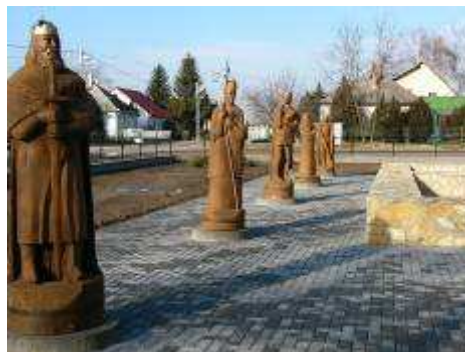
A bal oldali szoborsor