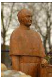
Boldog Apor Vilmos szobrának részlete