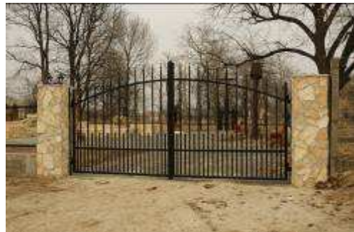
Az emlékpark bejárati kapuja

Vilmos Apor ( gestorben am 2. April 1945 in Raab ) war römisch-katholischer Bischof. Er war zuerst Hilfpriester in Jula und wurde später zu einem Bischof, der in Ungarns politischem und gesellschaftlichem Leben eine erhebliche Rolle spielte. 1944 protestierte er gegen die Judenverfolgung und Rassendiskriminierung in Ungarn. Am 30. März 1945 wurde er von russischen Soldaten der roten Armee niedergeschossen, weil er Verfolgte und Flüchtlinge, vor allem Frauen und Kinder im Keller der bischöflichen Residenz in Raab beschützen wollte. Vilmos Apor wurde am 9. November 1997 von Papst Johannes Paul II. selig gesprochen.