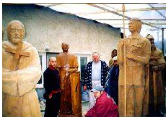
Elkészültek a szobrok