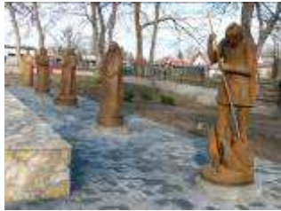
A jobb oldali szoborsor

Christianity state religion. According to the tradition, his baptism and confirmation was put down to St. Adalbert (+ A.D. 997. April 23. Gdansk) Bishop of Prague. Beginning from A.D. 1050 St Gellért (A.D. 1046. September 24. Buda) bishop and theologian, became the first bishop of our country to organize Christianity and during the fight the pagan insurgents of Vata he suffered martyrdom. Prince St. Imre (A.D. 1031. September 2.) son of St.