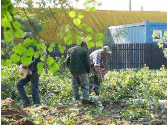
A parképítés kezdete

el, mely az egyes részfeladatokban jártas alvállalkozók segítségével a 2005 decemberére vállalt határidőre el is készítette.