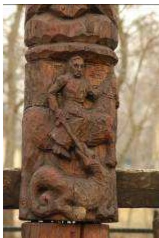
Sárkányölő Szent György a Jelkeresztén

A források megjelenése idején Inárcs már templomos falu volt, de hogy mióta, arra csak a régészeti feltárás deríthetett fényt. Az, hogy a falu és temploma jóval korábbi lehet a legrégebből ismert írásnál, már a III. Béla (1172–1196) nevéhez kapcsolt rézpénzek sejtene engedték. Ezek közt az egyiket ugyanis mint inárcsi típust különbözteti meg a numizmatika, mivel e 12. századi pénzből több is előkerült a faluban. Noha később már legtöbb helyen volt templom, Szent István II. törvényének 1. cikkelye szerint kezdetben még minden tíz falunak kellett építeni egyet, s elgondolkodtató az is, hogy a községünket övező korai településeggyüttesben (Kakucs Bes(e)nyő, Csíkos, két-két Kemej, Gun, Toton, továbbá Kuchna és Fancsal) egyedül Inárcson igazolható a templom léte.