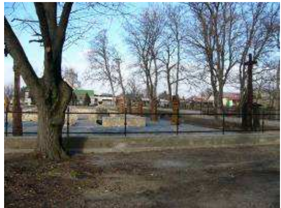
Az elkészült emlékpark

Mint látni fogjuk, a középkori inárcsi Szent György-templom emlékparkja helytörténetünk levéltári forrásokból és régészeti leletekből kirajzolódó sajátos lenyomata, önnön múltunk kézzelfogható darabja. 1998-as felszentelése után már a Jelkereszt is egyszerű polgárok sorát, sőt művészeket, tudósokat, politikusokat vonzott ide itthonról és külföldről is. Reméljük, e műalkotás-együttes sem csupán községünk lakóinak, hanem – az Ócsai Tájvédelmi Körzet idegenforgalmi és Pest megye turisztikai programjaihoz kapcsolódva – kultúránk megyei és regionális