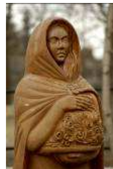
Szent Erzsébet szobra

Amikor Lajos elindult az ötödik keresztes hadjáratba, melynek során 1227-ben Itáliában pestisjárványban elhunyt, Erzsébet gyermekeivel (Hermann, Zsófia, Gertrúd) együtt Eisenachba menekült, végül Marburgban telepedett le. Özvegyi járandóságából menhelyet alapított, amit 1235-ben szenteltek fel, ő maga pedig teljes szegénységben és szigorú aszkézisben élt. Miután marburgi sírjánál 58 csodát jegyeztek fel, 1235. máj. 26-án IX. Gergely pápa szentté avatta. Legendáriumából legismertebb az emlékpark szobrán is ábrázolt rózsacsoda. Amikor szeretett férje tragikus halála után annak rokonai ellenszenvvel bántak vele, a szegényeknek elrejtett kenyerek eszerint kötényében rózsákká változtak. Sírja fölé Konrád türingiai tartománygróf 1236-ban gótikus templomot építtetett, ahol száz püspök és – a férje halála után kezeit hiába kérő – II. Frigyes császár jelenlétében helyezték végső nyughelyére. „Nem koronázhattam meg mint császárnét, most megkoronázom őt mint Isten országának halhatatlan királynőjét” – vett tőle végső búcsút az uralkodó.