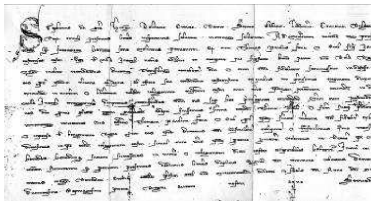
V. István 1271. évi oklevele

Az Inárcs és Kakucs középkoráról készült első tanulmány már 1982-ben világos képet rajzolt községiünk és temploma középkori elődjéről. Ezek helyét a Rákóczi, a Kecskeméti út és a vasút háromszögében már az 1970-es években lokalizálták a cserépedények, csont- és fémeszközök szórványelelei s a templomrom köveinek egyre gyérülő maradványai. Ezt a képet pontosította a teljes körű forráskutatás, melynek – régészeti terepbejárással kiegészült – eredményeit mind a szakma, mind a lakosság számára hozzáférhetővé tette az 1995-ben megjelenő kétkötetes Inárcs története, s újabb adatokkal gazdagította a templom maradványainak régészeti feltárása 2000 nyarán.