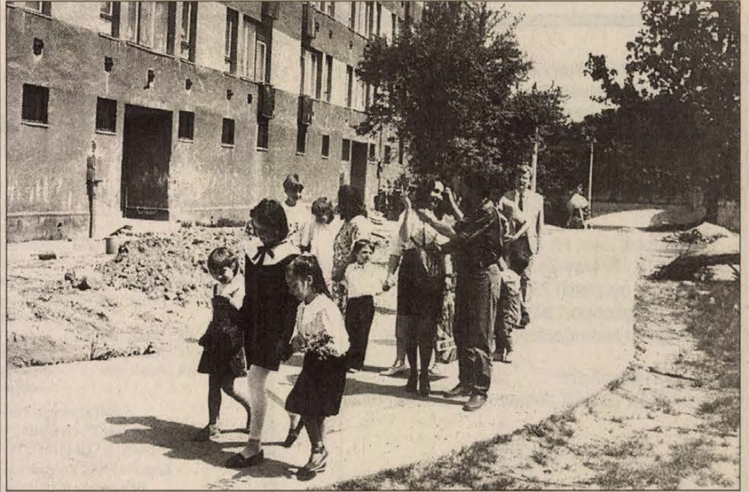
Az új lakóegyedben is egyre több az iskolás gyerek

Szeptemberben becsengetnek az új iskolában is