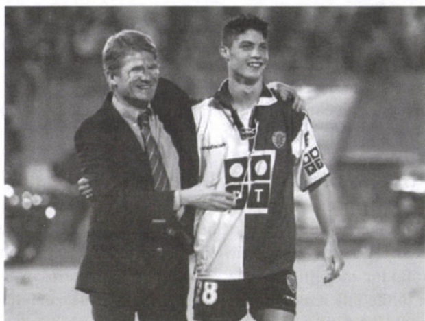
Bölöni László és felfedezettje, Cristiano Ronaldo

neve, de mégsem Önt, hanem nagynevű, de tapasztalatlan, külföldi kirakatedzőket szerződtettek, ahelyett hogy kiaknázták volna az Ön szakmai tapasztalatát, magyarságát.